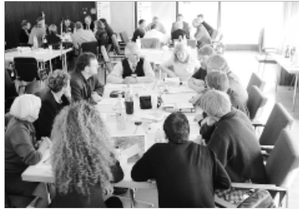
Abb. 1: Erste Werkstatt im Rahmen des Integrierten Handlungskonzepts Bonn-Beuel

pen ein Bürgerbegehren an, um die Planungen zu stoppen. Die Mehrheitsfraktion nahm daraufhin ihre Beschlüsse zurück. Das Verfahren wird nun unter Beteiligung des Arbeitskreises Konrad-Adenauer-Platz gänzlich neu aufgerollt. Sobald sich die Situation geklärt und entspannt hat, sollen auch die anderen im Integrierten Handlungskonzept entstandenen Arbeitskreise wieder gezielt aktiviert werden.