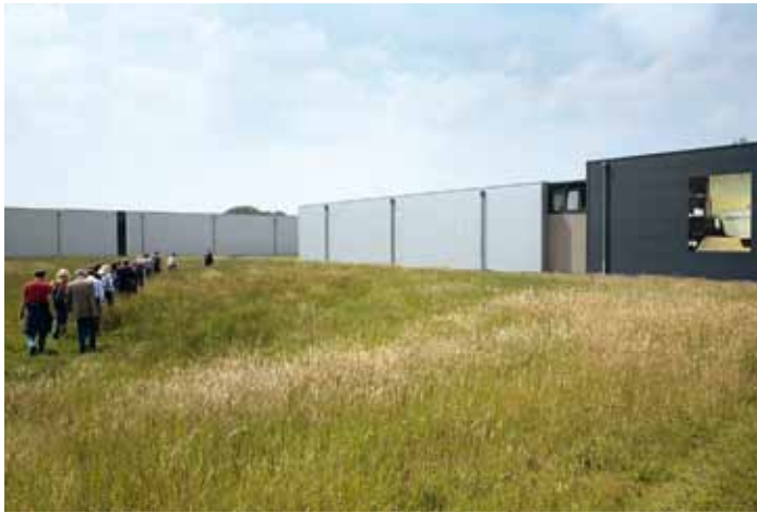
© L. Kannenbrock, Kreis Borken (2)