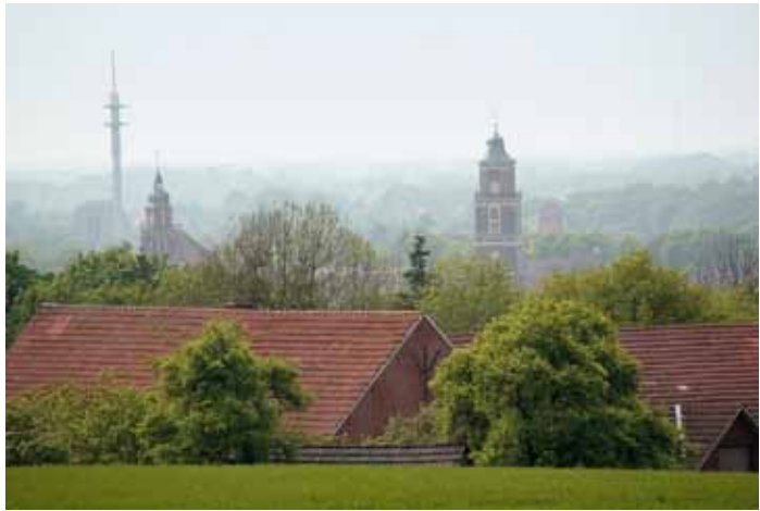
Münsterland – Wirtschaftsstandort (oben links) Münsterland – Wohnstandort (oben rechts)

novation, Wissen und Bildung sollten eine wichtige Rolle spielen. Auf die Beteiligung der Wirtschaft und der Bürgerschaft wurde großer Wert gelegt. Es galt also, einen Diskussionsprozess zu gestalten, der neben den „Raumfachleuten“ auch andere einbezieht. Resultat für das „ZukunftsLAND“: Der Verteiler für Informationen und Einladungen umfasst heute über 300 Personen, die sich bereits an der Arbeit und an Diskussionen beteiligt haben.